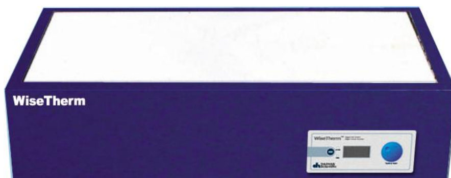
<Рис. 1> Внешний вид HP-LP

На рис.1 показан внешний вид нагревательной плиты WiseTherm ® HP-LP с цифровым управлением.